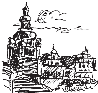
Pommern - Steettin - Haken-Terrasse