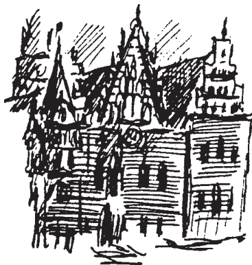
Schlesien - Breslau - Rathaus